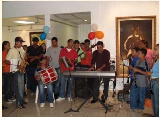
El viernes 7 de diciembre, los niños y jóvenes disfrutaron de una tarde inolvidable.