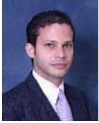
Por Edwin Espinal Hernández

Para entender el origen de San José de las Matas hay que partir de un documento clave: la instancia dirigida por los pobladores del “Partido de las Matas” el 29 de agosto de 1810 a las autoridades de la colonia, solicitando autorización para la fundación de una villa capitular, “una Villa de españoles con Cabildo”, como se indica textualmente. Su lectura deja al descubierto dos claves importantes.