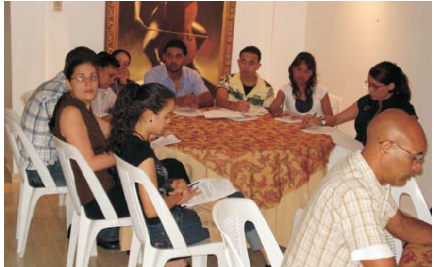
Vista parcial de los comerciantes asistentes al curso.

El mismo, es el primero de una serie de cursos que la institución tiene en agenda para desarrollar a favor ese sector productivo, con la finalidad de contribuir a que el per-