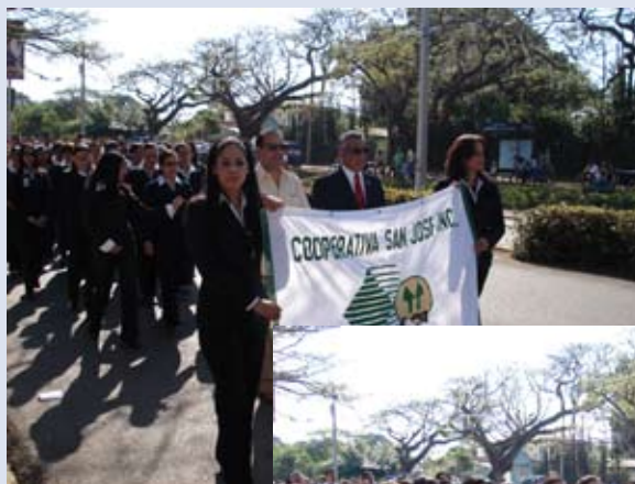
Directivos y empleados de la Cooperativa, mientras participaban en el desfile.

La institución contó con una nutrida representación integrada por directivos, ejecutivos y empleados, quedando demostrado con ello que la Cooperativa San José apoya las causas nobles, y rinde honor a la patria en los actos que a ella se le dedican.