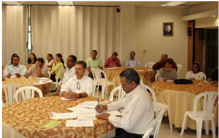
Vista parcial de los delegados participantes en la Carrera Dirigencial.

dos y delegadas de la Cooperativa San José en el manejo eficiente de asuntos sociales, económicos y empresariales.